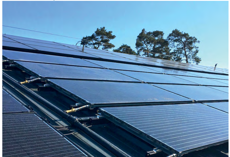
80 m2 SOLINK-Anlage in Lütlich (BE)